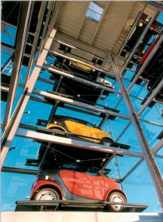
Freier Blick auf das Automobil

Der smart tower wurde europaweit ca. 70 Mal in Betrieb genommen.