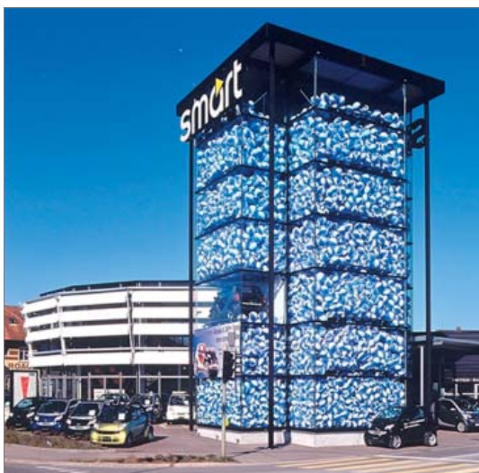
Einbindung der Kunden durch Ratespiel

Gezielte Einbindung des smart towers bzw. smart cubes in event-Aktivitäten zur Kundenbindung und Gewinnung von Neukunden.